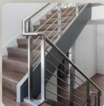
Нержавеющая сталь, хром