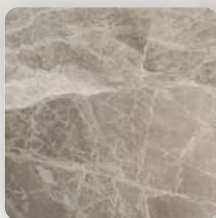
Камень натур. и искусственный